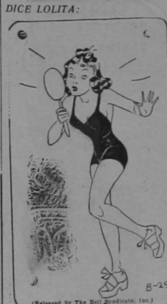
(Released by The Bell Syndicate, Inc.)