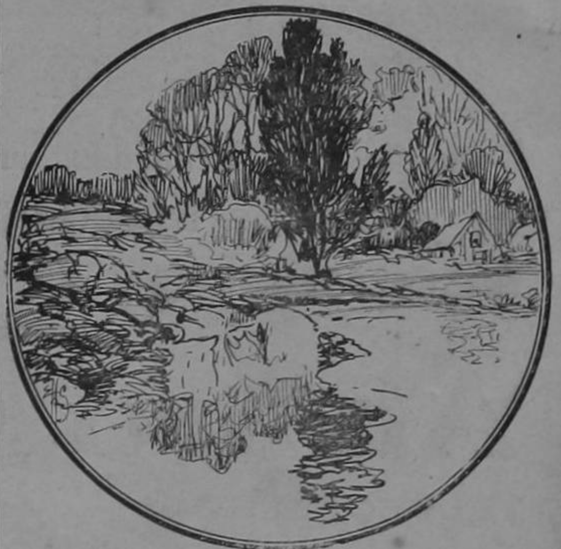
¿Cuál es la figura perdida?

Esto es, que el amigo no tiene ninguna dirección. ¡Cómo se parece en esto a los de la Alianza Democrática!