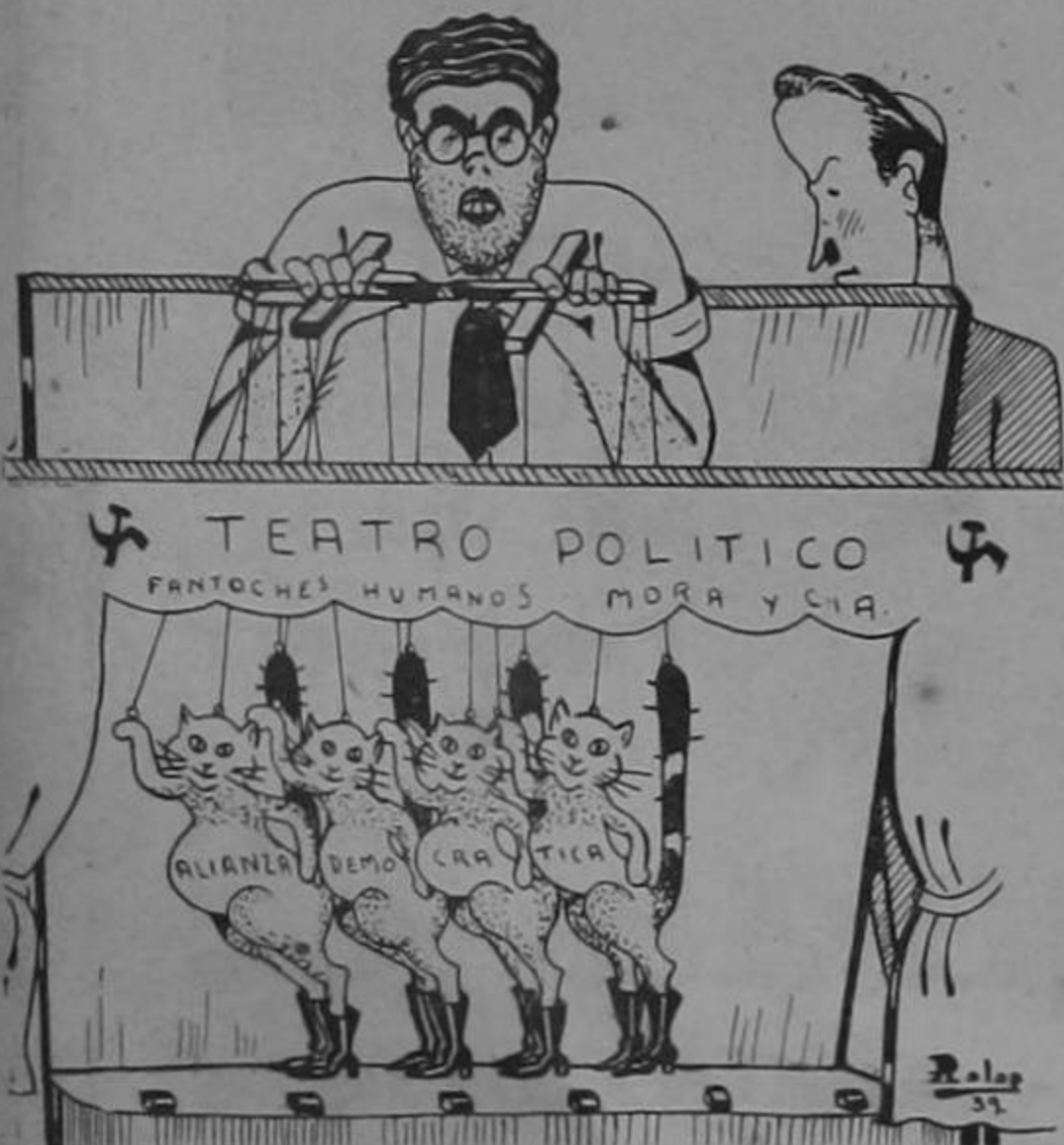
Dibujo para colorar